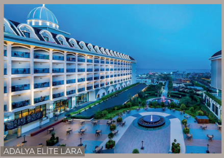
ADALYA ELITE LARA